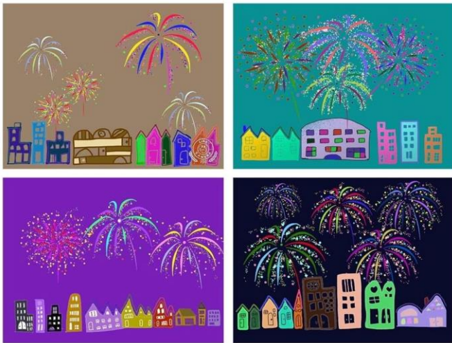
昨年描いた「花火」も入れて作品を仕上げました。