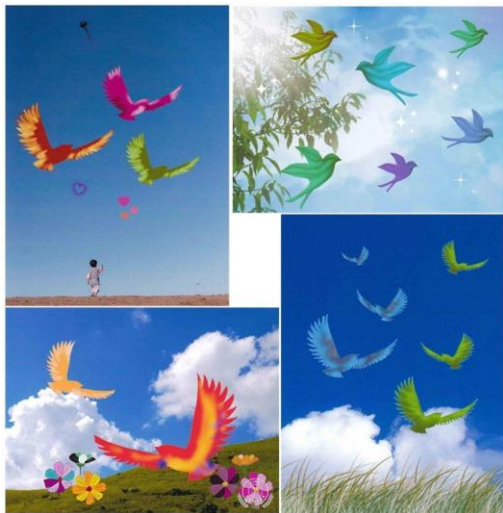
夏の大き空に羽ばたきましたね。