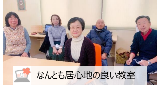
なんとも居心地の良い教室

パソコン教室に通うようになってもう4年になります。ほんのちょっとだけ、そう思って教室を訪ねたのですが、驚く程長く通っていることになります。気軽に何でも教えて下さる先生と、教室のメンバーの皆様との居心地の良さがこんなに長く通うことに繋がったのだと思います。