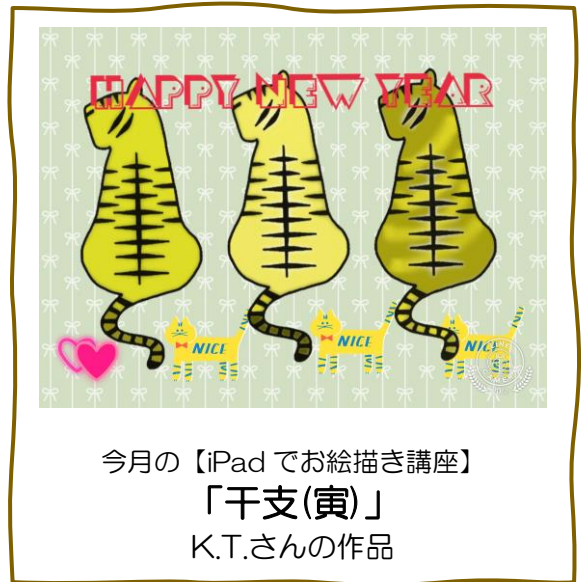
今月の【iPadでお絵描き講座】 「干支(寅)」 K.T.さんの作品

実は、今年の夏は二つのオンラインツアーを体験しておりました。 ブラジルの「アマゾン河の二河川合流点の圧巻映像！アマゾン河の水上集落訪問&巨大魚ピラルク釣りの釣り掘り体験付きライブツアー」（ベルトラ） 「LIVE 中継で行くドバイ・スパイスツアー 政府公認ガイドと巡る異国情緒たっぷりのドバイ旧市街」（ベルトラ） いずれも、Zoom を利用したオンラインツアーでした。 次回は、日本国内で楽しんでみようと思っています。 皆さんも一緒にいかがですか？（P.4 にご案内しております）