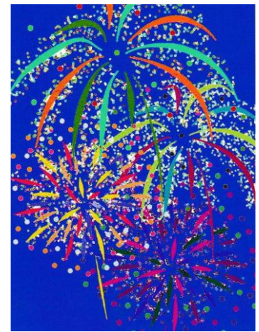
今月の【iPadでお絵描き講座】 「花火」 Sさんの作品

定員は、抽選で10名さま。満席でした。ご参加の皆さまのスマホは、iPhone、Android、らくらくスマホと機種も様々です。